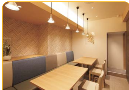
出来立てのうどんやラーメンも 食べれるイートインスペース23卓