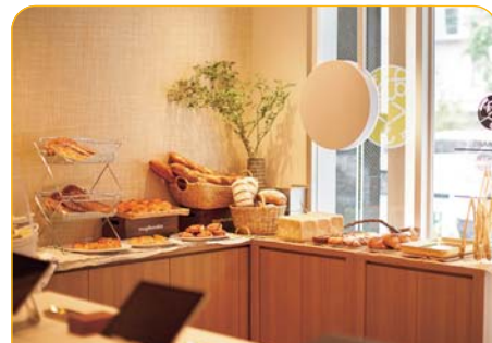
厨房で焼いたパンやピザ、 陳列棚でグラノーラなどが販売できる ※ピザに関してはリースになりますので 事前にお問い合わせください。